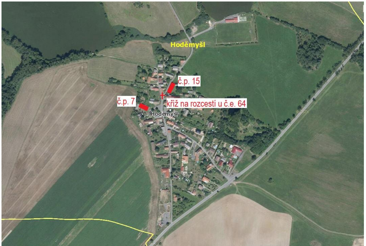
Obr.: architektonicky cenné stavby - Hoděmyšl