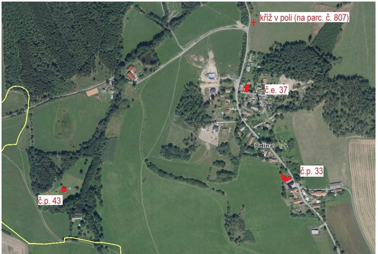
Obr.: architektonicky cenné stavby - Belina