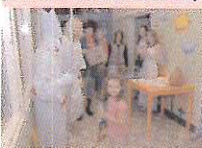
Děky studentům SZS Příbram mohli děti hospitalizované v příbramské nemocnici oslavit Mikuláše.