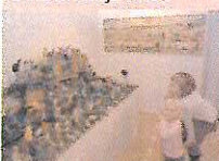
Hornické muzeum Příbram opět vystavovalo betlémy. Výstava přilákala malé i velké návštěvníky.