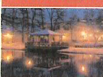
Romantický pohled na zasazený altánek na Horejší Obora.