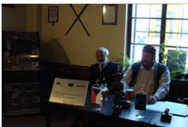
Součástí úvodu bylo i promítnutí filmu o historii Březových Hor a hornictví: