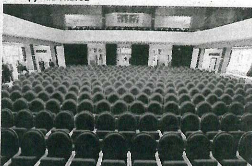
Kralupy nad Vltavou

Kulturní dům v Kralupech nad Vltavou, který se neopravoval více než 45 let, se dočkal výrazných změn. Dotace činila 7,7 milionů korun.