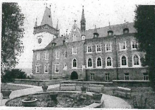
Zruč nad Sázavou

Z fondů EU byla hrazena rozsáhlá rekonstrukce Zámku ve Zručích nad Sázavou. První etapa oprav se konala před pěti lety, kdy se podařilo z evropských peněz získat téměř 16 milionů korun. V roce 2010 byla ukončena druhá etapa (dotace z ROP činila 84,2 milionů korun).