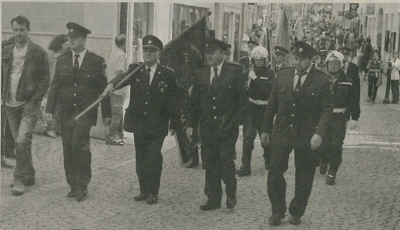
SLAVNOSTNÍ otevření začalo průvodem.

Městského úřadu Příbram povolil vykácení sedmi kusů lip. Stromy kolem kostela byly nahrazeny novými. „Během přípravy projektu se s výměnou lip kolem kostela nepočítalo. Ale v průběhu prací se teprve ukázalo, jak moc kořeny stromů poškozují základy kostela. Všiml si toho také farář kostela svatého Jakuba, který o výměnu stromů požádal. Statik nás ve svém odborném posudku zase upozornil na nenávratné poškození schodů. A to jak schodiště z čelní strany kostela, tak i staršího a vzácnějšího schodiště na jižní straně budovy,“ vysvětlil starosta.