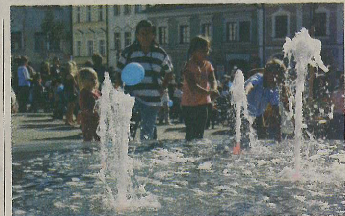
Snímky ze sobotní slavnosti k otevření nově opraveného náměstí TGM v Příbrami do redakce zaslal Jiří Kubík.