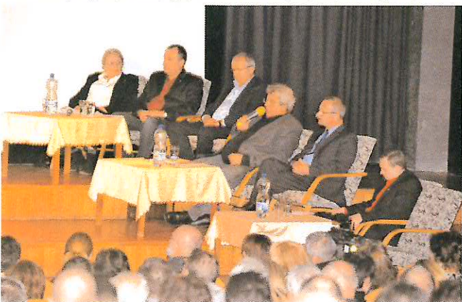
Členové Rady města Příbrami se v příbramském kině dne 20. 3. 2012 zúčastnili besedy s podnikateli.