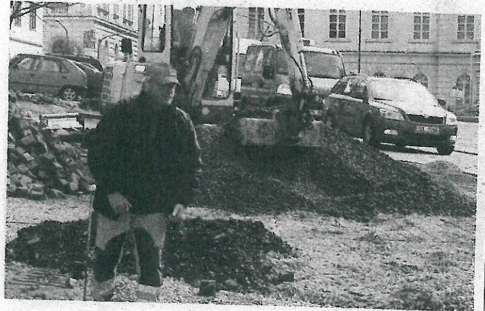
REVITALIZACE NÁMĚSTÍ TGM v Příbrami bude kompletní koncem srpna.

Zastupitelé schválili příbramské římskokatolické farnosti 800 tisíc korun na