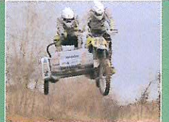
Bratři Čermákové zahájili trénink na novou sezónu na M5 v sidecar-crossu. Držíme palce!