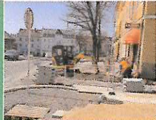
Na náměstí T. G. Masaryka pokračují práce - kameníci pokládají dlažbu před Kahanem.