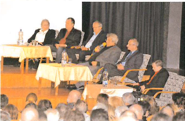
Členové Rady města Příbrami se v příbramském kině dne 20. 3. 2012 zúčastnili besedy s podnikateli.