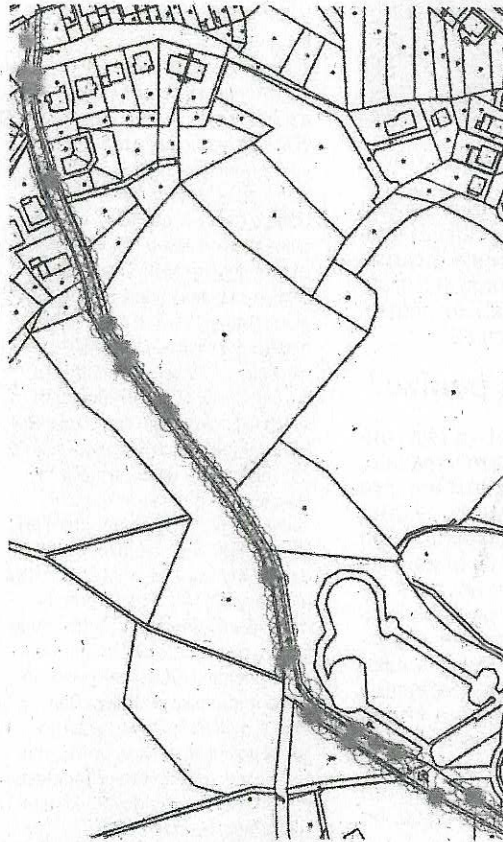
VYZNAČENÉ ZELENÉ BODY jsou dřeviny, které budou v aleji vysazeny.

Svatohorská alej je nejen významným krajinným prvkem, ale rovněž vytváří přirozenou spojnici města s příměstskou oblastí. Pokáceny byly podle odborníků stromy, které těsně sousedily s asfaltovou cestou a byly ve špatném stavu. „Z výzkumu