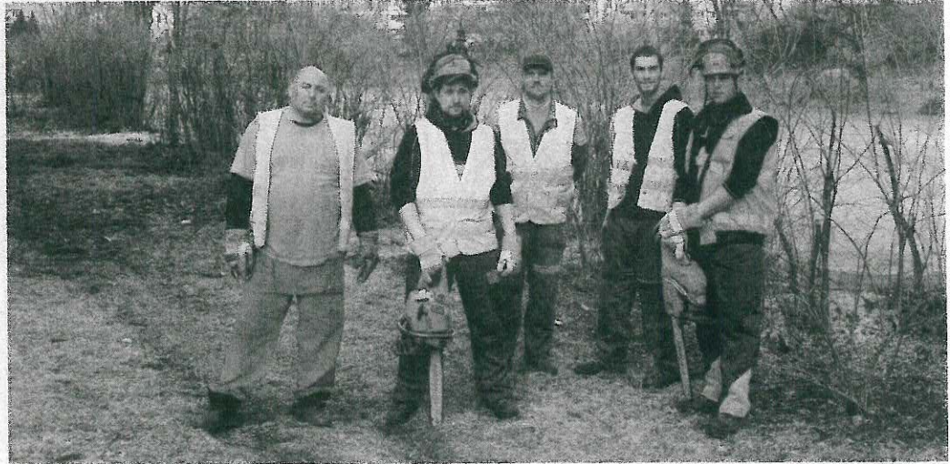
PARTA ODBORNÍKŮ, kteří mají obnovu zeleně v Příbrami na starosti.

„Při prořezávání musí být kladen cit na zásahy do krajiny. Něco jiného je prostředí parků, které musí zůstat při-