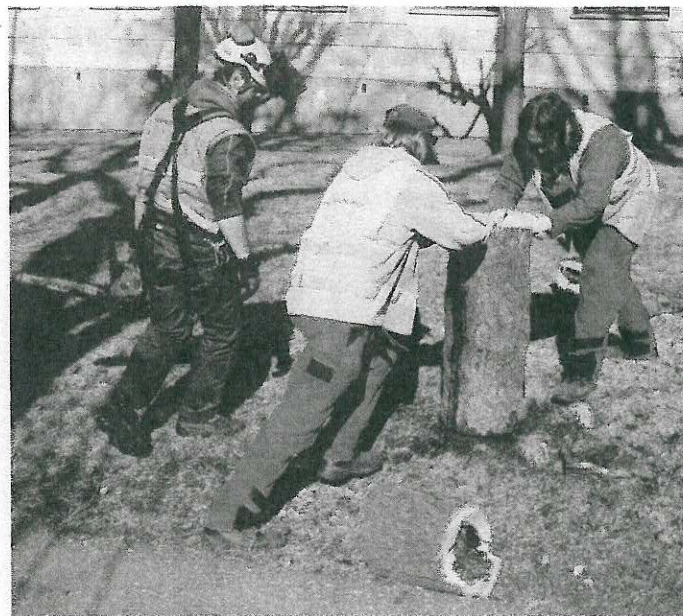
Z JIRÁSKOVÝCH SADŮ zmizelo v pátek několik jírovců. Některé ze stromů mohly svým pádem do budoucna ohrozit bezpečnost chodců.