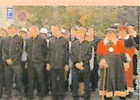
Začátkem října každého roku můžete v Příbrami potkat slavný průvod horníků a hutníků, který je pořádán v rámci synyozia Hornická Příbram ve vědě a technice. Akce vřelou slavností "Skolem přes kůži".

Bible včera, dnes a zítra patovní výstava v Knihovně J. Drdy 29. 11. - 2. 12. 9 - 18 hodin