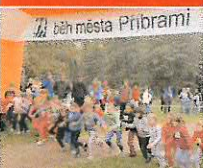
Záběr z letošního ročníku Běhu města Příbram.