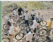
Účastníci VIA NOVA studentská TOUR CYKLOPOUTÍ Příbram - Bodenmais 2011.