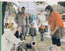
Ve dnech 24. - 25. 6. se konaly Městské slavnosti. Bohatý program s nadsněním vítaly hlavně děti.