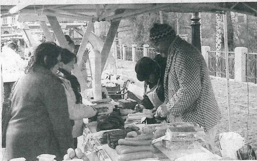
Dlouhé fronty se tvořily hlavně u stánku s masnými výrobky.