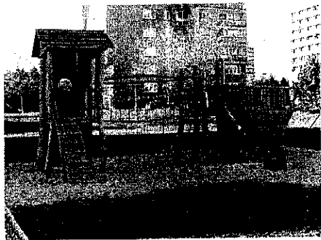
Hřiště zdobí hrací prvek v podobě lodi

Další, v pořadí již osmé dětské hřiště slouží od minulého týdne příbramským dětem. S jeho stavbou se začalo 6. listopadu a práce byly ukončeny 24. listopadu. Hřiště splňuje veškeré požadavky hygienických a bezpečnostních norem na provozování a výstavbu dětských hřišť. Je v plném souladu s pravidly Evropské unie. Hřiště se skládá z velkého her-