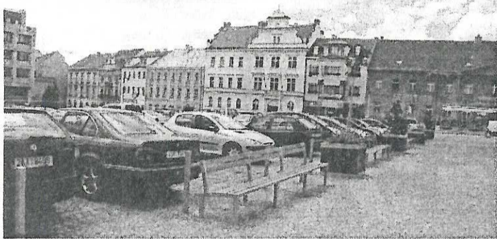
Rekonstrukce náměstí se blíží do finále. Některým občanům se změna náměstí líbí, některým ne. Na snímku jsou opuštěné lavičky hned u parkujících aut.

A jak je to s konkurencí u vypsání soutěží? V roce 2012 byla podle www.veschnyzakazky.cz pouze jedna nabídka podána u jedné vypsání