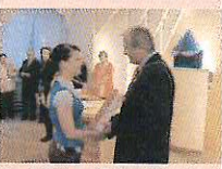
Dne 25. 5. proběhlo v Zámečku - Emetina ocenění bezpříspěvkových dárců krve. Stříbrnou plaketu prof. Jana Janského za 20 bezplatných odběrů obdrželo 29 dárců, zlatou plaketu za 40 odběrů 19 dárců a 12 dárců bylo oceněno zlatým křížem III. stupně za 80 bezplatných odběrů krve. Ocenění předal místostarosta Václav Černý.

Zastupitelstvo města Příbram vyhláše 2. výběrové řízení na poskytování půjček vlastním domům a bytů na území města Příbram pro rok 2010 z fondu FOM a stanovuje následující podmínky výběrového řízení: