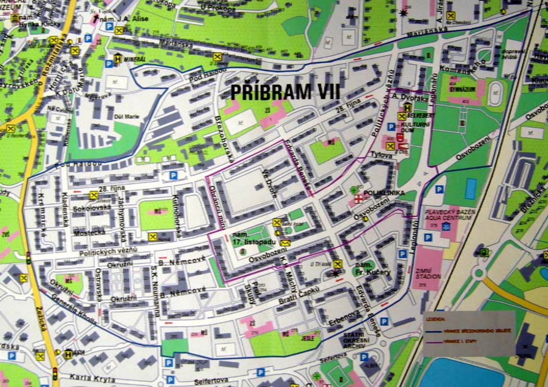
IPRM PRO ZÓNU BŘEZOHORSKÉHO SÍDLIŠTĚ