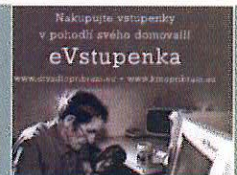
Divadlo A. Dvořáka připravilo pro své diváky novinku: eVstupenku, kterou si můžete koupit přímo z domova.