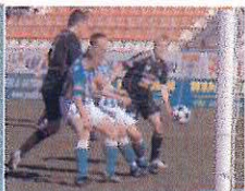
Snímek se vracíme k zápasu 1.FK Příbram s FC Bohemians 1905. Naši prohráli 0:1 a stále bojují o záchranu.