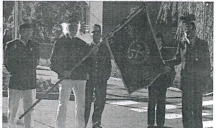
NA SLAVNOSTI nechyběli ani členové Spolku Prokop Příbram.