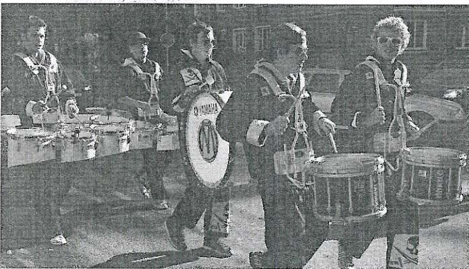
SKUPINA Marimba Live Drums zahrála nejen sobě do kroku.