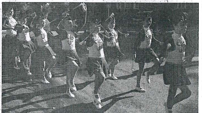
PŘÍBRAMSKÉ mažoretky předvedly svoje umění.