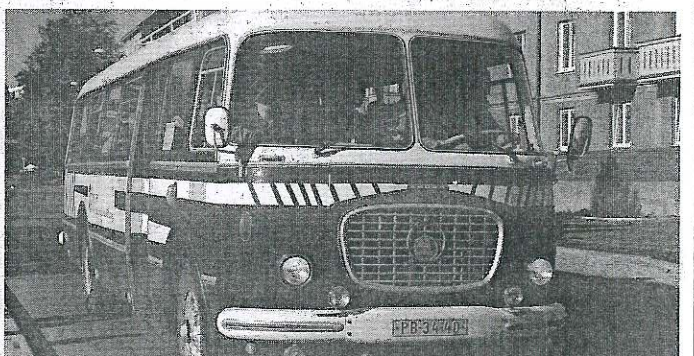
PŘÍBRAMANÉ mohli zavzpomínat a svězt se ve „staré dvojce“.