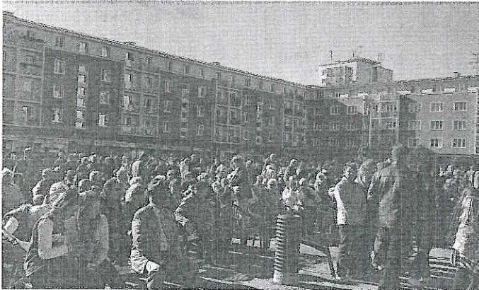
OBYVATELÉ Příbrami se přišli podívat na nově upravené náměstí.