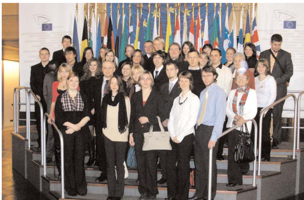
Studenti příbramského Gymnázia pod Svatou Horou navštívili Evropský parlament ve Štrasburku.