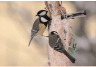
Zimní přikrmování ptáčků.