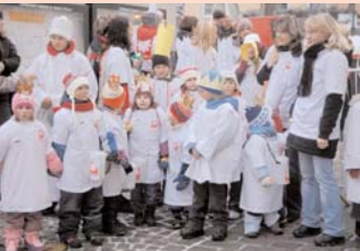
Děkujeme Farní charitě Příbram za organizaci Tříkrálové sbírky. Výtěžek je vždy věnován těm nejpotřebnějším.