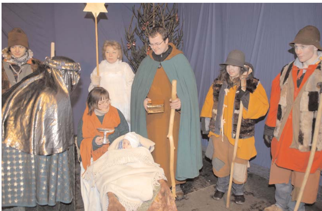
Ve středu 6. ledna 2010 do Příbrami opět přijeli Tři králové na živých velbloudech. Tato akce vždy přiláká hodně lidí, zejména rodičů s dětmi. Počasí bylo mrazivé, ale to k lednu patří. V rámci tohoto setkání byla zahájena Tříkrálová sbírka, jejíž výtěžek je určen pro potřebné. Těšíme se na příští rok, že se všichni ve zdraví shledáme.