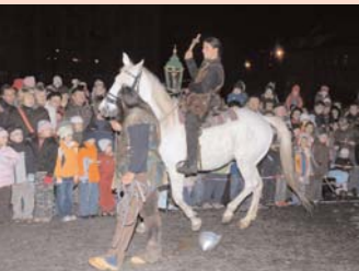
Dne 11. listopadu přijel do Příbrami sv. Martin na bílém koni. Přivítali ho malí Příbramáci, kteří spolu se svými rodiči zaplnili náměstí T. G. Masaryka. Celou akci zajistil Spolek Prokop.