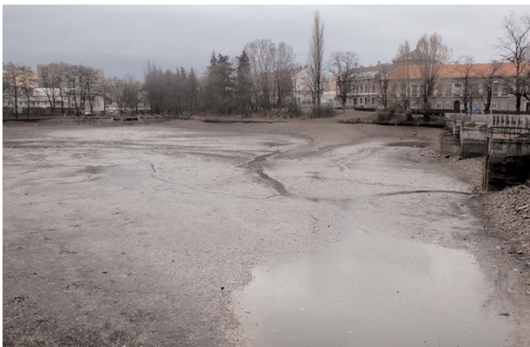
Vypuštěním Hořejší Obory byla zahájena rekonstrukce oblasti Dvořákova nábřeží.