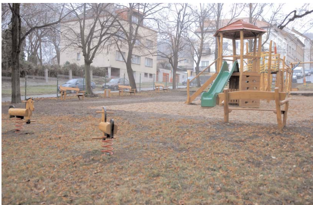
Další dětské hřiště bylo postaveno na Komenského náměstí v Příbrami III.