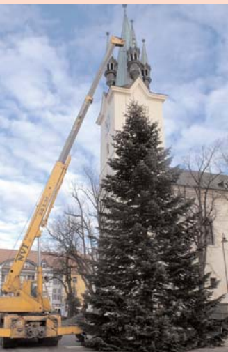
Nastala příprava na sváteční období. Pracovníci Technických služeb Příbram instalovali krásný vánoční strom na náměstí T. G. Masaryka.