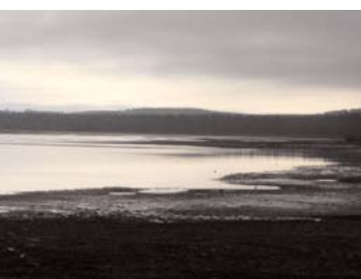
Podzimní nostalgie u Padrťských rybníků.