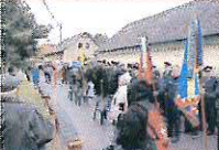
Dne 18. června oslavili dobrovolní hasiči z Jeruzaléma 85. výročí založení svého sboru. U příležitosti této oslavy pořadatelé připravili pěkný program, včetně tradiční akce Dobytí Jeruzaléma křížáky.