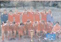
Dne 19. 5. se uskutečnilo "Velké finále" středoškolského poháru ve fotbale. Tohoto finále se zúčastnili i žáci SPŠ a VOS Příbram. Družstvo je složeno nejen z hráčů I.FK Příbram, ale i z fotbalistů hravějších nežsi součtce. Nakonec toto družstvo "Velké finále" vyhrálo a odvlezo si spoustu hodnotných cen - i tu nejdohodnější cenu, a to zájezd na pobávorec utání BAYERNU MNICHOV.

Oznámení o uzavření místní komunikace ul. Březnická Městský úřad Příbram, odbor správy silnic, oznamuje, že z důvodu výkopových prací pro uložení plynovodního potrubí, prováděné firmou REVIS-LIBEREC, spol. s r. o., Hampolecká 108/3, Liberec 5, dojde k následujícím opatřením: V termínu od 7. 7. do 8. 8. 2010 bude uzavřena v Příbrami IV. místní komunikace ulice Březnická v úseku od ul. Mariánská až ul. Osvobození.