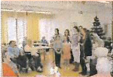
Pečovatelská služba města Příbram jako každý rok připravila pro své klienty vánoční setkání.