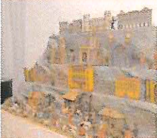
Homické muzeum Příbram vystavovalo v Galerii F. Druška v Zámečku-Ernestinu betlémy.