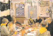
Vánoční knenová nadílka skautského oddílu Mohawk přinesla opět radost a mnoho zážitků pro členy knene a jejich rodiče.

Zastupitelstvo města Příbram v y h l a s u j e 1. výběrové řízení v roce 2011 na poskytování příspěvků vlastnickým bytů a obytných budov na území města Příbram pro rok 2011 z fondu oprav a modernizace (FOM).