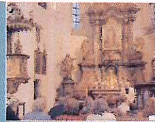
V pátek 27.5. se také v Příbrami konala "Noc kostelů". Jednotlivé farnosti připravily příjemný program.