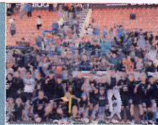
Snímkem se vracíme k zápasu 1.FK Příbram s FC Zbrojovka Brno. Naši vyhráli 1:0 a udrželi se v 1. lize.