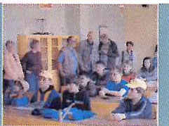
V Příbrami se odehrála soutěž mladých včelařů "Zlatá včela". Děti zde předvedly své včelařské dovednosti.