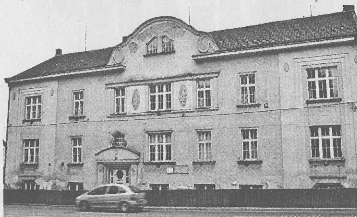
Druhým objektem, kde by mohlo vzniknout několik nájemních bytů, je budova, kterou v minulosti obývaly městské lesy

Jak již bylo řečeno, město má zpracovaný projekt, a v současné době čeká, zda uspěje ve vyhlášené výzvě a získá dotace na výstavbu, které činí 650 tisíc korun na jeden byt. Zajímalo