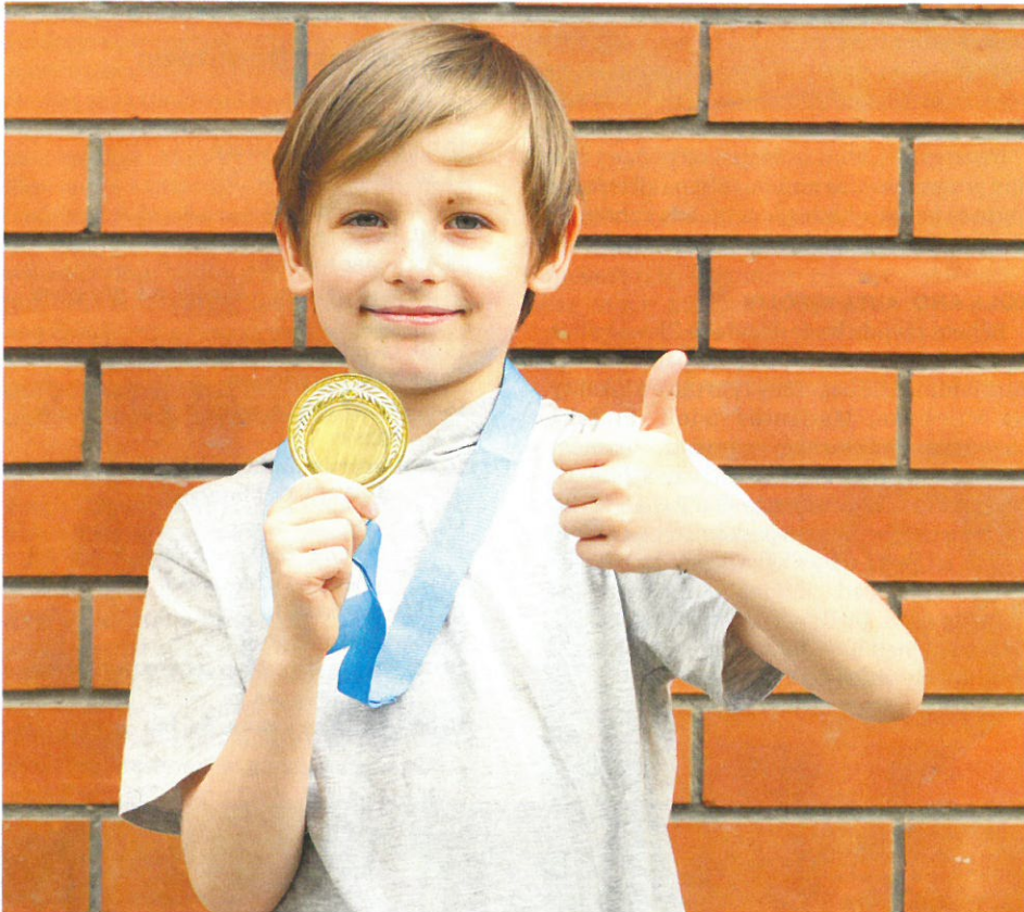
Medaile budou pro každého aktivního účastníka.

Termín Dne sportu v Příbrami se rychle blíží. Celodenní program startuje v 9.00 a je nabitý soutěžemi, sportovními exhibicemi a dalšími aktivitami, které doplní účast hvězd českého sportovního života. Koho na Nováku v sobotu 10. června uvidíme?