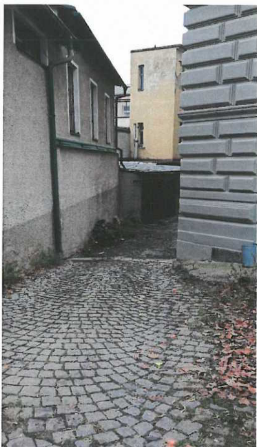
p. č. 36/1 a p. č. 37 v k. ú. Příbram – vnitřní pohledy (ze dvora radnice)