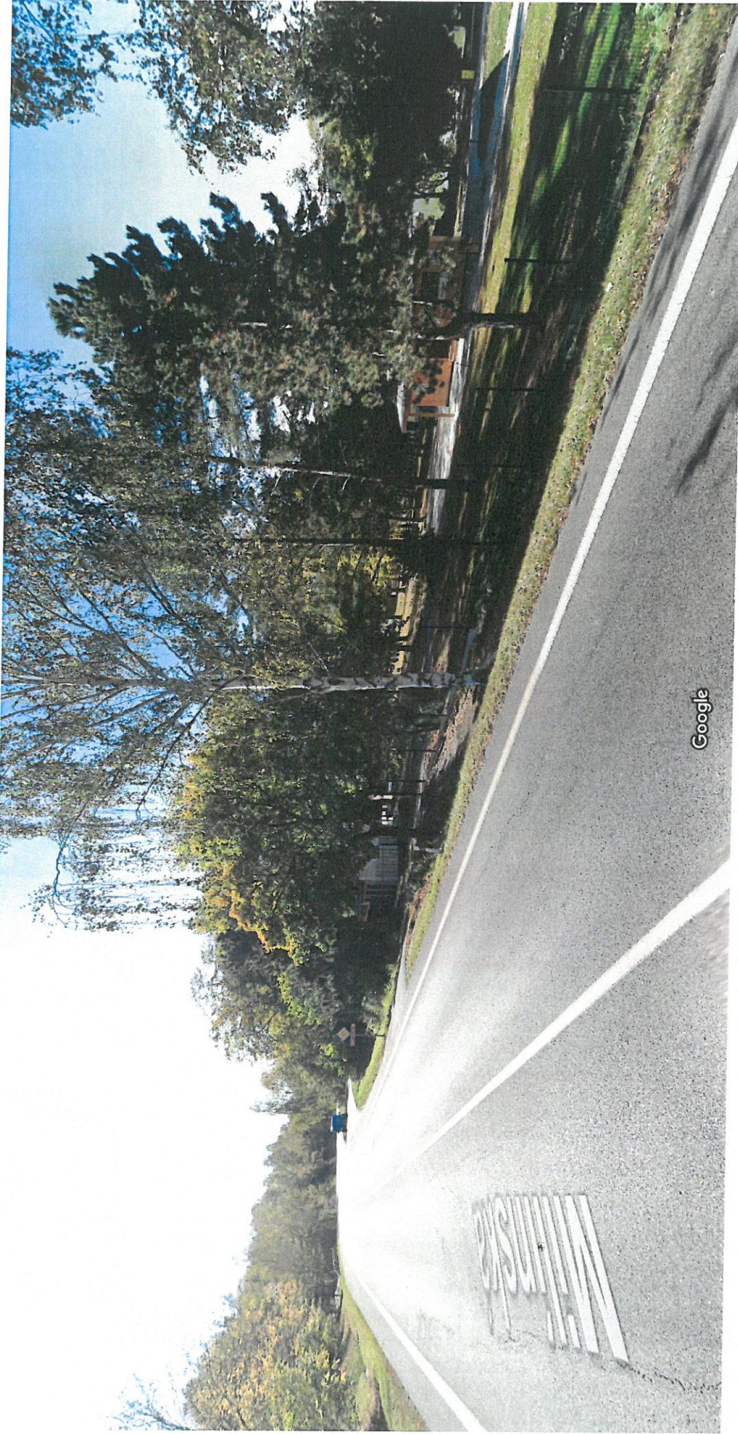
Příbram, Středočeský kraj